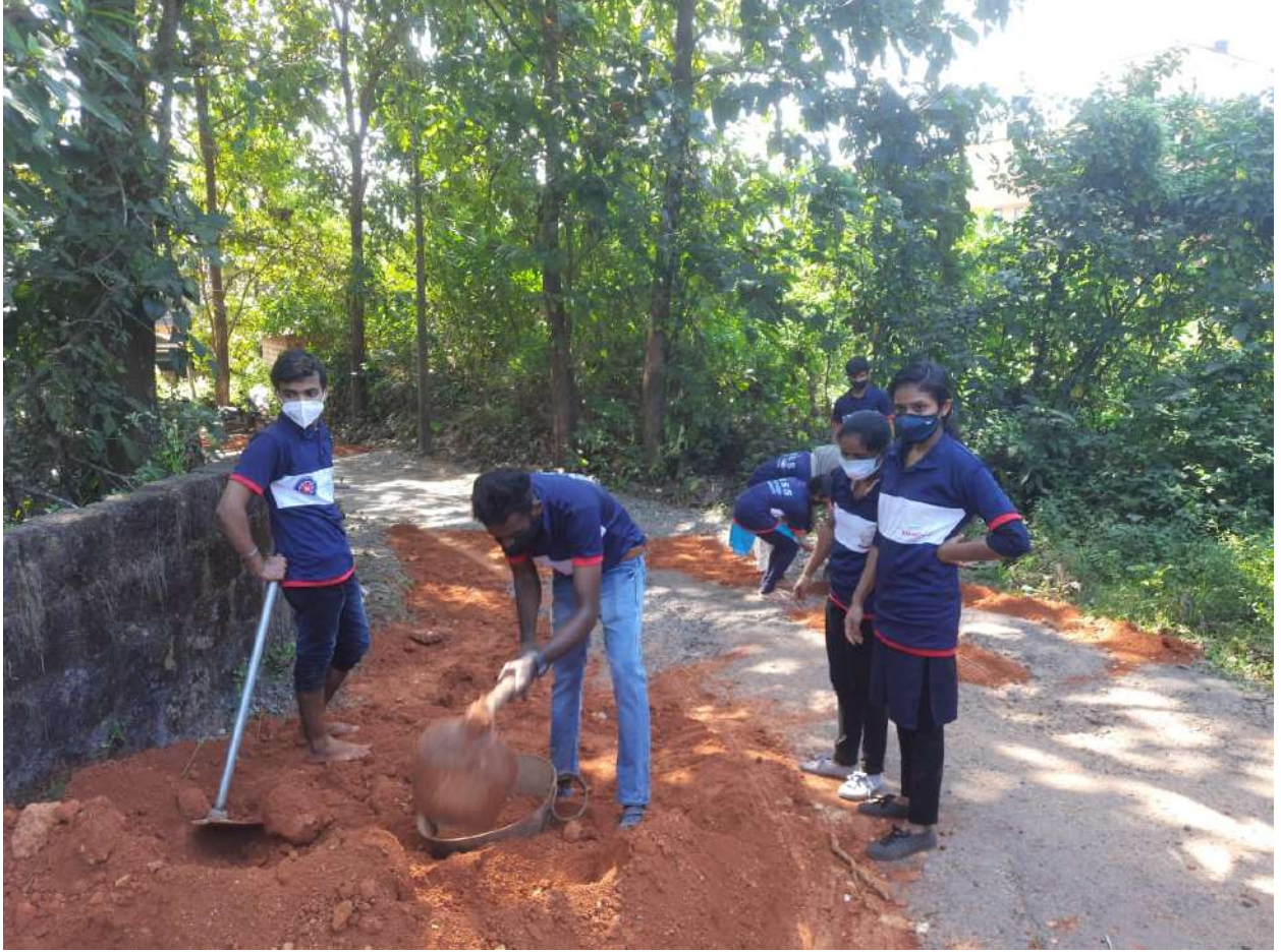
Sreekandapuram Police station road construction